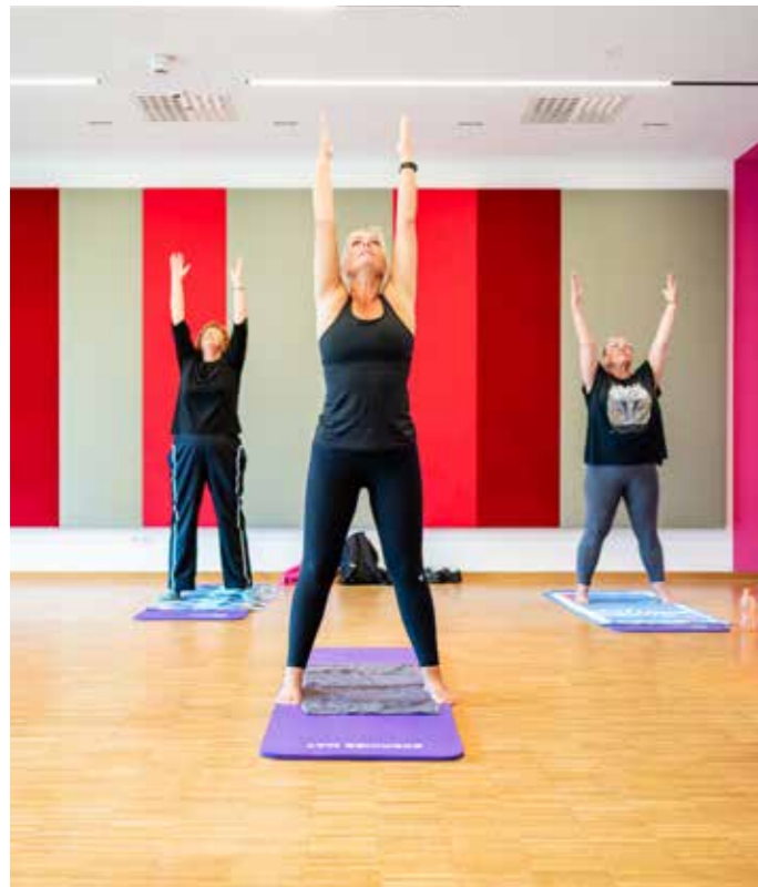
Sport und Entspannung im Kurhaus

Der Kurpark und die umgebenden Wälder eignen sich zu jeder Jahreszeit fürs Wandern, Nordic Walking, Joggen, Rad fahren und viele weitere Aktivitäten. Ob individuell oder in der Gruppe – beides ist möglich. Jede Woche finden im Kurhaus und im Kurpark verschiedene Kurse mit ausgebildeten Trainern statt, denen man sich nach Lust und Laune anschließen kann. Gymnastikmatten und Zubehör sind vorhanden und die bodentiefen Fenster geben den Blick mitten in den Kurpark frei – so macht das Training Spaß. Wer mag, nimmt im Anschluss ein entspannendes Bad in der benachbarten Jod-Sole-Therme.