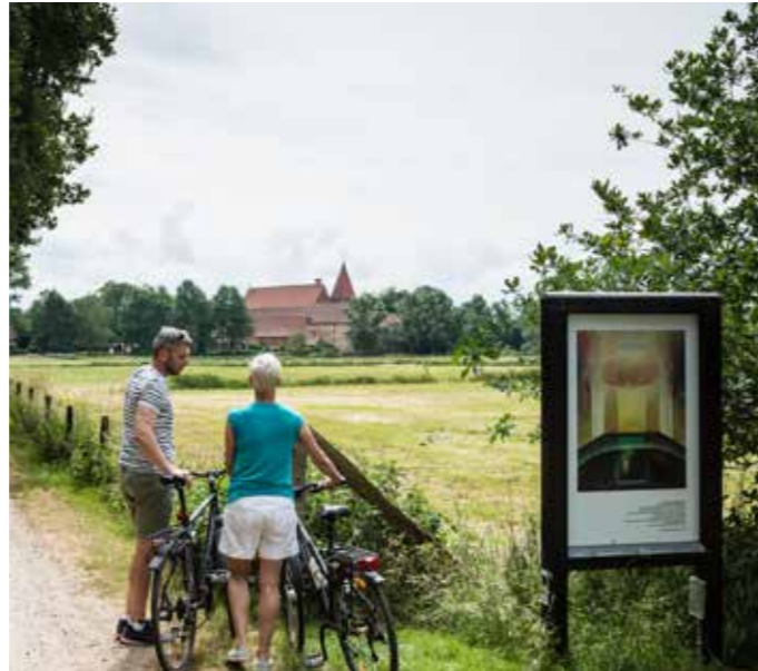
Besinnungswege rund ums Kloster Ebstorf

Die Ebstorfer Weltkarte – berühmt und weltbekannt! Sie ist mit ihren fast 13 qm die größte und anschaulichste Weltkarte des Mittelalters. Und sie ist damit auch der Schatz des Klosters Ebstorf. Die Klosteranlage aus dem 14. und 15. Jahrhundert ist vollständig erhalten und mit Kreuzgang, Nonnenchor und vielen besonderen Kunstschätzen ein lohnenswerter Besuch. Eine Führung durch das Kloster und ein Gang über die historischen Rundwege über die Domäne lohnt sich immer.