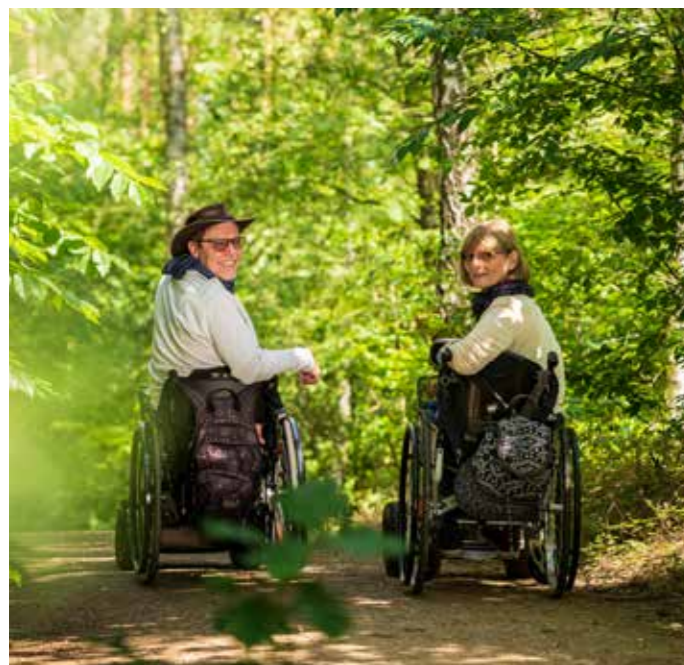
Wanderer auf dem Rollstuhlwanderweg

Ein befestigter Wanderweg für Menschen, die im Rollstuhl unterwegs oder nicht mehr gut zu Fuß sind, beginnt gegenüber des barrierefreien Heidehotels. Der ca. 700 m lange Rundweg führt durch einen lichten Kiefernwald. Den Wanderern begegnen unterwegs allerlei aus Holz geschnitzte tierische Bewohner des Waldes. Ein kleiner Abstecher führt zum Elbe-Seitenkanal. Genügend Ruhe- und Sitzplätze sind auf dem Rundweg vorhanden und die Wege sind wunderbar eben und breit.