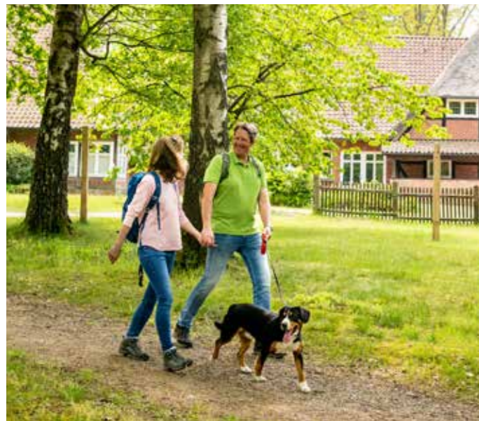
Wanderer unterwegs in der Heideregion Uelzen

Weiteres Informationsmaterial erhalten Sie kostenlos bei: HeideRegion Uelzen e.V. | Herzogenplatz 2 | 29525 Uelzen info@heideregion-uelzen.de | www.heideregion-uelzen.de