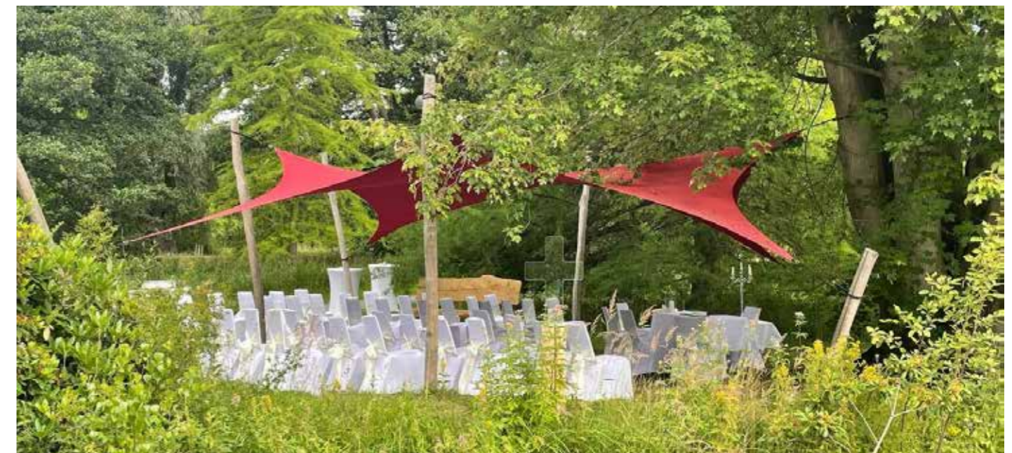
Heiraten im Kurpark

Weitere Informationen gibt es im Internet unter www.kurhaus-bad-bevensen.de .