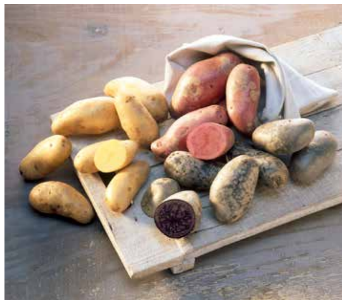
Heidekartoffeln in allen Farben

Typisch für die Lüneburger Heide ist die Heidschnucke. Das leicht wildartig schmeckende Fleisch verarbeiten die hiesigen Köche zu raffinierten Braten oder zu saftigem Gulasch. Dazu passen Heidekartoffeln sehr gut, ebenso zu Forellen, die in der Lüneburger Heide gerne und oft angeboten werden. Nicht zu vergessen: Der hervorragende Spargel der Region, der wie Kartoffeln auf den sandigen Böden vorzüglich gedeiht.