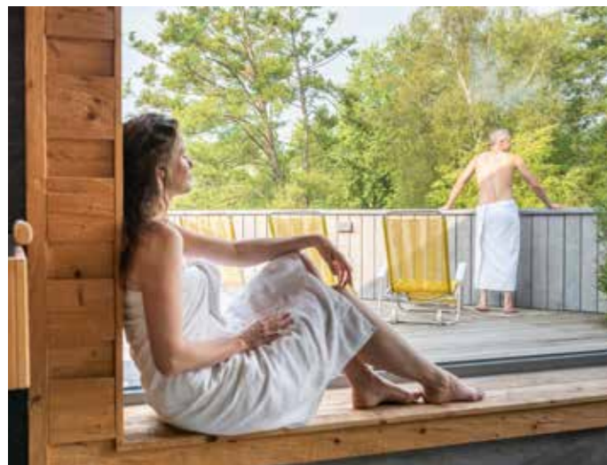
Saunaterasse mit Ausblick ins Grüne

Das sprichwörtliche Bad Bevenser Wohlgefühl stellt sich sofort ein, wenn Sie in die warmen Fluten der Therme eintauchen. Gleich mehrere Innen- und zwei Außenbecken laden zum geruhsamen und entspannten Schwimmen ein. Das Vitalbecken mit seinen Sprudel-Liegeflächen und -Sitznischen und das Gesundheitsbecken mit wohligen 35 Grad Wassertemperatur. In den Außenbecken lassen Sie sich durch den Strömungskanal treiben und unter Schwall- und Nackenduschen massieren. Die Ruheräume erlauben einen wunderschönen Blick auf die großen Außenbecken und den angrenzenden Kurpark.