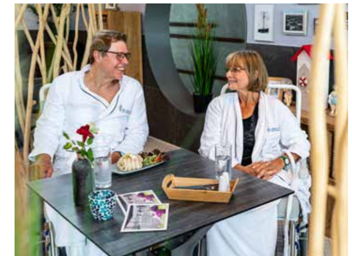
Leckere Speisen im Bistro der Therme

Noch mehr Tipps und Neuigkeiten aus der Jod-Sole-Therme finden Sie auch bei Facebook, Instagram und im Newsletter.