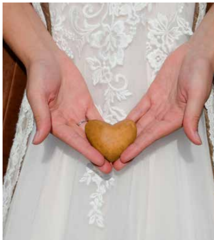
Ein Herz für Heidekartoffeln