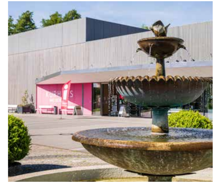
Das Kurhaus – eine moderne Veranstaltungsstätte

Sie haben etwas zu feiern? Dann haben wir die passende Location für Sie. Die unterschiedlich großen, gut kombinierbaren Räume des Kurhauses sind ideal zum Feiern, und können für verschiedene Anlässe wie Hochzeiten und Jubiläen gemietet werden. Größere Gesellschaften haben viel Platz im Kursaal oder im gesamten Kurhaus.