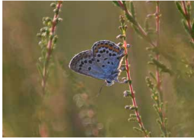
Argus-Bläuling in der Klein Bünstorfer Heide

Von kleinerem Ausmaß, aber dennoch idyllisch und »typisch Heide«: Auch in und bei Bad Bevensen gibt es Heideflächen. 2 km südlich vom Stadtzentrum liegt die Klein Bünstorfer Heide. Mitsamt angrenzendem Wald und entlang des Heideflüsschens Ilmenau ist es ein herrliches Gebiet zum Wandern und Rad fahren.