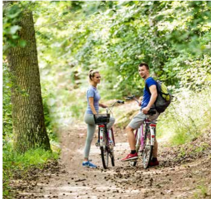
»Wald und mehr« – eine der Radtouren